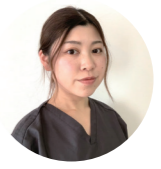
HANOWA Name あんさん 歯科衛生士

— HANOWAの魅力は? いろいろな歯科衛生士業務をさせていただいているおかげで、もっと勉強したいとか、毎日レベルアップしようって思いながら働けるようになりましたし歯科衛生士として、前よりも自信が持てる